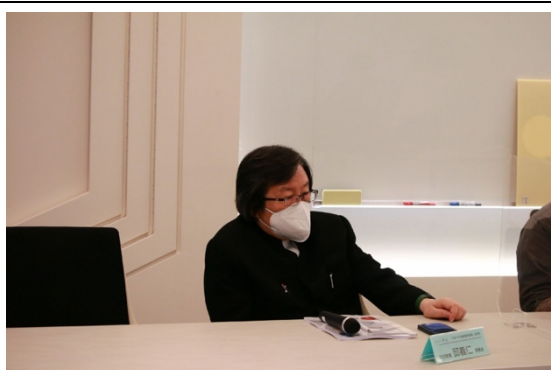
中華足協邱義仁理事長