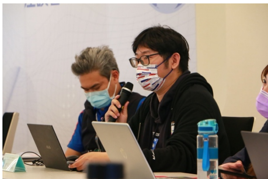
1 中華足協焦佳弘副秘書長