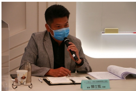
女足國家代表隊總教練顏士凱