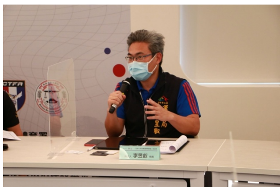
台中市政府運動局李昱勳局長