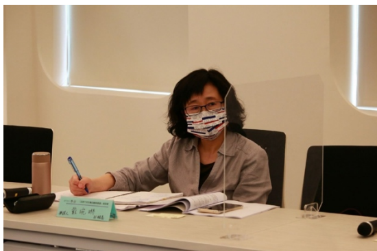
教育部體育署競技組副組長戴琬琳