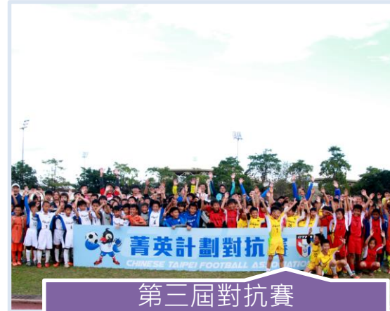
第三屆對抗賽 2016年1月30-31日 地點：臺東