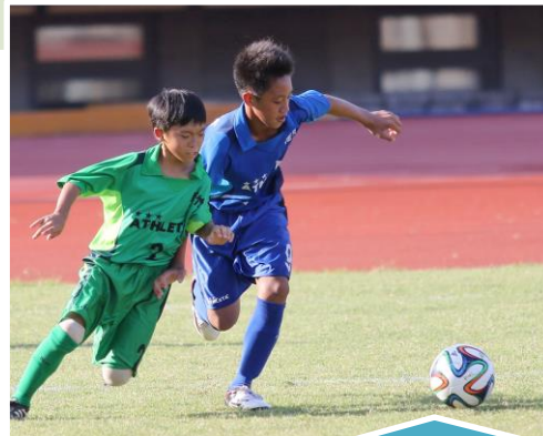
第二屆對抗賽 2015年6月28-29日 地點：新竹