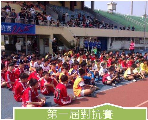
第一屆對抗賽 2015年1月30-31日 地點：高雄